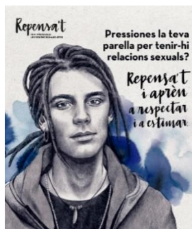
Cartell de la línia "Repensa't"

Adona't. Línia adreçada a les dones per tal d'identificar situacions d'abús i violència i conèixer els recursos existents. En aquesta línia s'han creat quatre cartells amb missatges diferents, un quadríptic informatiu, tres espots, bosses de cotó amb l'eslògan de la campanya i dues sessions formatives sobre violències masclistes en l'àmbit rural.