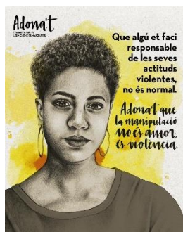
Cartell de la línia "Adona't"

amb un enfocament 360° amb accions específiques per a cinc col·lectius estratègics: dones, homes, infants, joves i professionals.