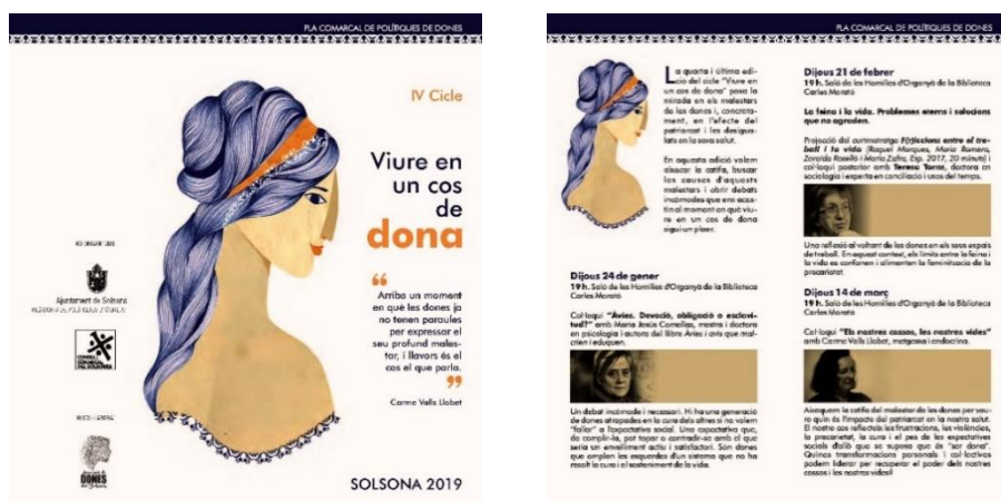
Díptic del IV Cicle “Viure en un cos de dona”. Edició 2019

Al llarg de quatre edicions i en el marc del projecte “Viure en un cos de dona” es van realitzar diferents tallers i conferències per abordar la salut i la qualitat de vida de les dones des d'una mirada de gènere. Es van tocar temes com la sexualitat, el dol i les pèrdues, l'impacte del pes de les cures en la salut així com les desigualtats i biaixos de gènere en l'àmbit de la salut.